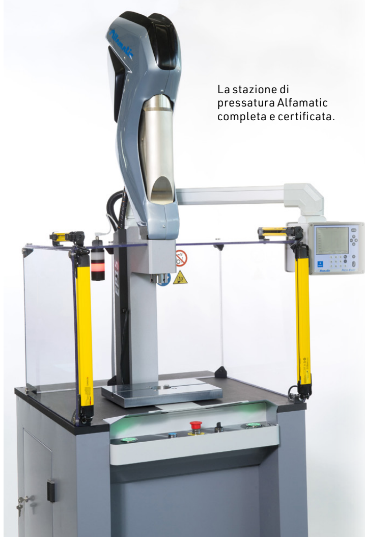
La stazione di pressatura Alfamatic completa e certificata.