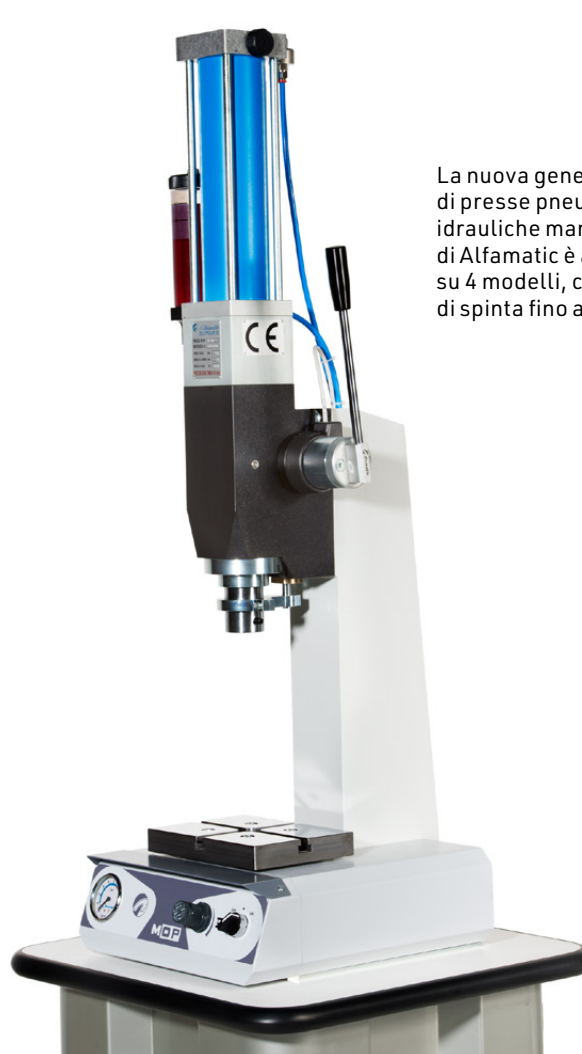
La nuova generazione di presse pneumatiche manuali MOP di Alfamatic è articolata su 4 modelli, con forze di spinta fino a 80 kN.

rando non solo elevata durata anche in condizioni gravose di utilizzo, ma elevata resistenza all'impatto e dimensioni esterne contenute. «Nonostante la notevole forza di spinta – ribadisce Colombo – il sistema, disponibile sia come cilindro completo di sistema di controllo sia come stazione di pressatura pronta all'uso, garantisce la stessa capacità di riprodurre le prestazioni e il grado di precisione, la stessa capacità di controllare in maniera puntuale il carico, il punto di arresto dello stelo, la ripetitività del carico applicato e così via, degli altri modelli della gamma».