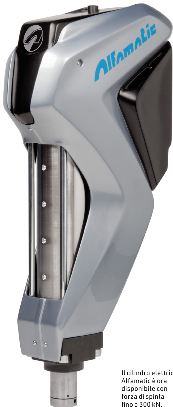
Il cilindro elettrico Alfamatic è ora disponibile con forza di spinta fino a 300 kN.

SEMPRE ATTENTA ALL'INNOVAZIONE E EVOLUZIONE DI PRODOTTO, ALFAMATIC HA RECENTEMENTE AMPLIATO LA PROPRIA GAMMA DI PRESSE ELETTRICHE, ORA DISPONIBILI CON FORZE DI SPINTA FINO 300 kN, OLTRE AD AVER DATO DISPONIBILITÀ DI UNA NUOVA GENERAZIONE DI PRESSE PNEUMO-IDRAULICHE AD AZIONAMENTO MANUALE.